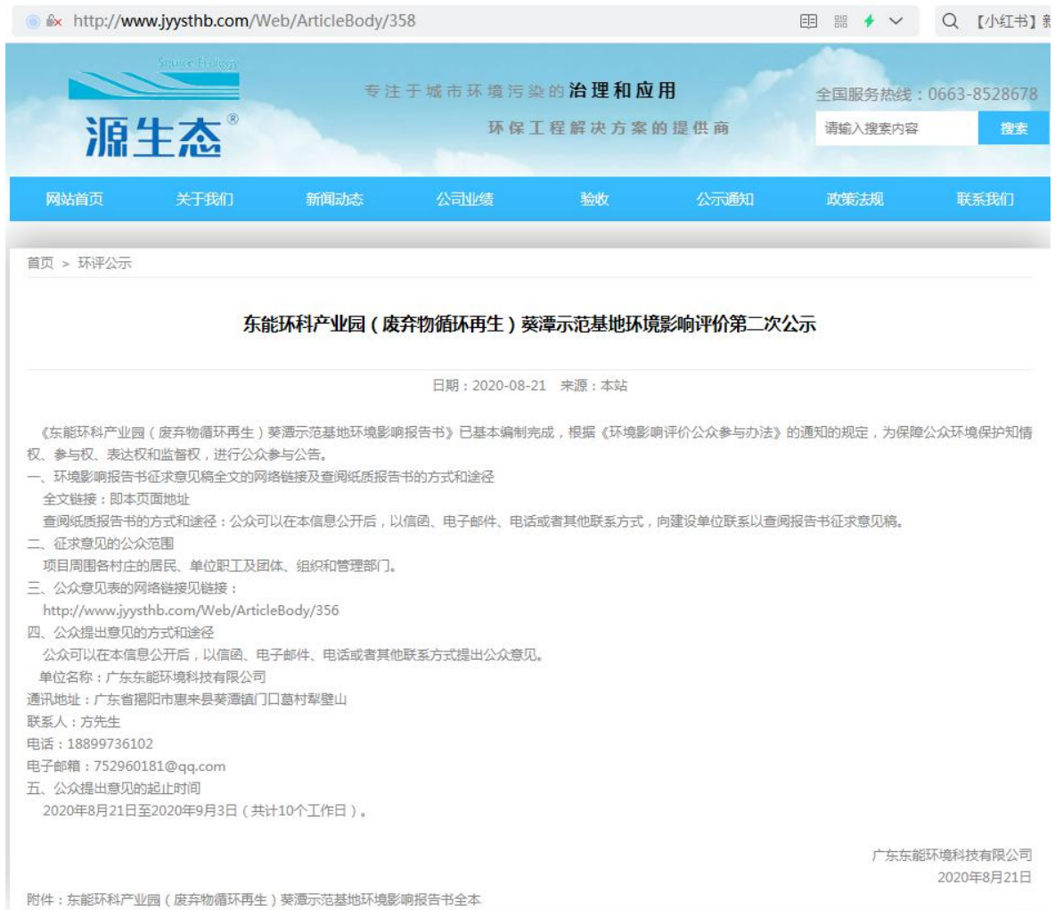
图 3.2-1 第二次公示网站截图