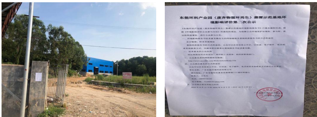
项目所在地第二次公示