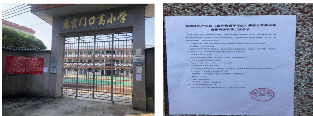
门口葛小学第二次公示