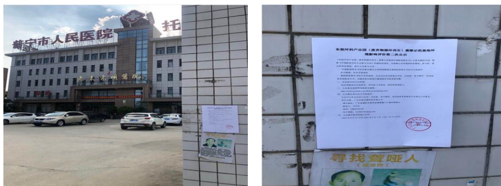
惠来东明医院第二次公示