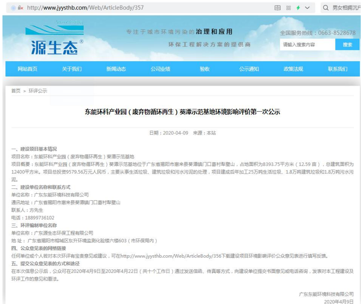
图 2.2-1 第一次公示网站截图